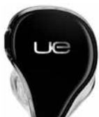
UE LEGACY LOGO