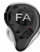
EIGENE INITIALEN CHROM

EIGENE INITIALEN AUFPREIS +50 € netto (MAXIMAL ZWEI BUCHSTABEN)