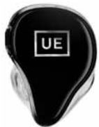
UE NEW LOGO

EIGENE INITIALEN AUFPREIS +50 € netto (MAXIMAL ZWEI BUCHSTABEN)